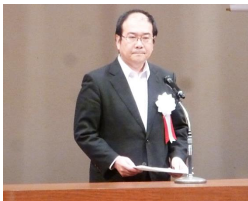
大会宣言発表及び採択