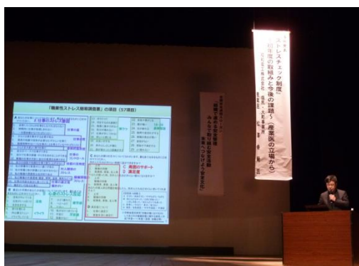
松澤産業医による「ストレスチェック制度～初年度の取組みと今後の課題～」についての事例発表